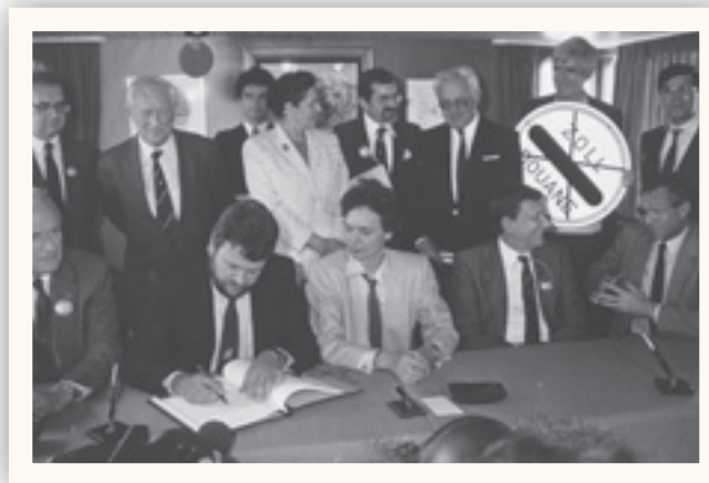
Jean Weyrich, Archives Luxemburger Wort

Zniesienie kontroli na granicach z Austrią (podpisanie umowy w kwietniu 1995 r.)