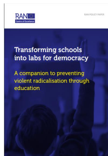
Figure 1 Transformer les écoles en laboratoires de la démocratie (2018)

Comme c'est le cas des autres documents européens, celui-ci doit aussi être traduit et accompagné d'une introduction avant d'être utilisé à l'échelle locale. Par exemple, l'aspect religieux ou les partenaires qui