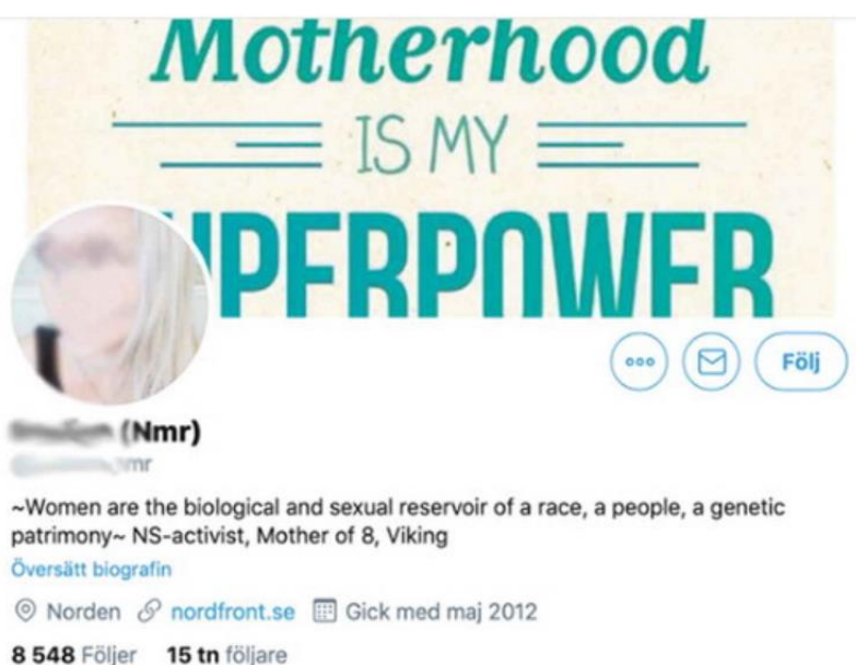
Ilustracja 4: Konto na Twitterze członkini Nordyckiego Ruchu Oporu