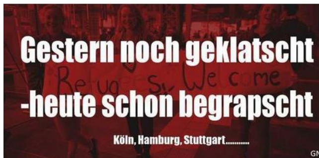
Ilustracja 1: Obraz uzyskany z Facebooka

użytkowników Internetu filmy informacyjne wydają się jednak szczególnie autentyczne, ponieważ sprawiają wrażenie, że informacje są przekazywane przez „zwykłych” ludzi. Organizacje i grupy ekstremistyczne są świadome podatnych na wpływ odbiorców, dlatego wykorzystują YouTube jako kluczową platformę do rozpowszechniania swoich ideologii i narracji, ale także do udostępniania filmów przypominających filmy wizerunkowe. Chociaż niektóre grupy, takie jak stosunkowo nowa grupa stowarzyszona z Hizb-ut-Tahrir „Muslim Interaktiv”, tworzą znacznie więcej nagrań na TikTok, nadal produkują wysokiej jakości i stosunkowo rozbudowane filmy na YouTube (8) . Jeśli chodzi o treści, kanały prawicowych i islamskich ekstremistów mają tendencję do powielania stereotypów dotyczących płci, koncentrując się na precyzyjnej koncepcji dwóch płci poprzez odwoływanie się do „naturalnych” ról płciowych (9) .