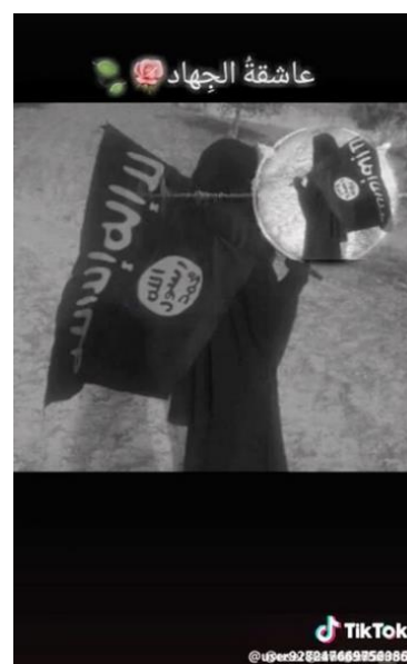
Ilustracja 3: Zrzut ekranu z filmu opublikowanego przez zablokowane konto na TikToku powiązane z Państwem Islamskim

W 2019 r., po tym jak Państwo Islamskie utraciło kontrolę nad terytoriami swojego samozwańczego kalifatu w Syrii i Iraku, około dwóch tuzinów kont powiązanych z Państwem Islamskim (później usuniętych) trafiło na TikToka, aby udostępniać filmy propagandowe. Według Elisabeth Kendall, ekspertki ds. ekstremizmu na Uniwersytecie Oksfordzkim, „ta chwytna metoda propagowania ideologii ISIS oznacza, że rozprzestrzenia się ona szybko i pozostaje w zbiorowej pamięci” (19) . Wiele z tych filmów zostało wyprodukowanych specjalnie z myślą o młodych dziewczętach. Obraz na ilustracji 3 przedstawia zrzut ekranu z jednego z filmów,