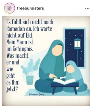
Ilustracja 7: Napis na obrazie mówi: Nie czuję, że trwa Ramadan. Nie czekam na Id al-Adha. Mój mąż jest w więzieniu. Co teraz robi i jak się czuje?

Bliskie kontakty w mediach społecznościowych istnieją również w formie sieci solidarności. Konto na Instagramie „freeoursisters” publikuje wyrazy solidarności z kobietami i dziewczętami, które opuściły dawne obszary Państwa Islamskiego i są obecnie przetrzymywane w ośrodkach detencyjnych w Syrii i Iraku lub