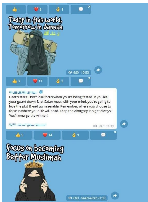
Ilustracja 5: Komunikacja między członkiniami grupy islamskich ekstremistów na Telegramie

Grupy islamskich ekstremistów i strony w mediach społecznościowych, które są specjalnie skierowane do młodych kobiet, są zwykle bardzo kolorowe, często zawierają popularne klipy