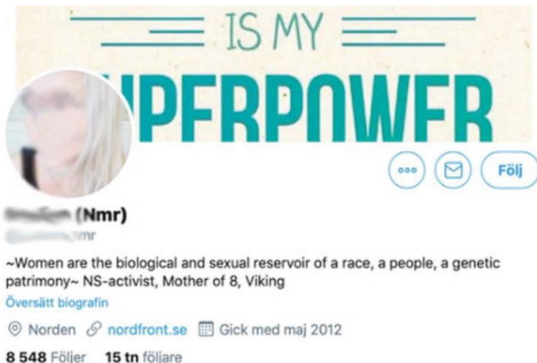
Joonis 4. Naissoost Põhjala Vastupanuliikumise liikme Twitteri konto

Joonisel 4 on kujutatud kuvatõmmis Põhjala Vastupanuliikumise naissoost keske figuuri Twitteri kontost. Põhjala Vastupanuliikumine ja muud paremäärmuslikud liikumised aitavad kujutada naisi ja tüdrukuid võimestatud poliitiliste häältena emaduse ja pere eest hoolitsemise kaudu, tugevdades nii narratiivi naistest kui valge rassi „päästjatest“. Sarnaseid suhtlustaktikaid ja narratiive võib kohata eri paremäärmuslaste liikumistes ja sotsiaalmeediagruppides. Kuigi tüdrukute ja naiste seisukohti ja postitusi sotsiaalmeedias kontrollivad enamasti mehed või teised (vanemad) naissoost liikmed, kes soodustavad propagandat, et naised on meestele allutatud, käsitleb suur osa sisust ka naiste võimestamist ja ühtekuuluvustunnet (36) .