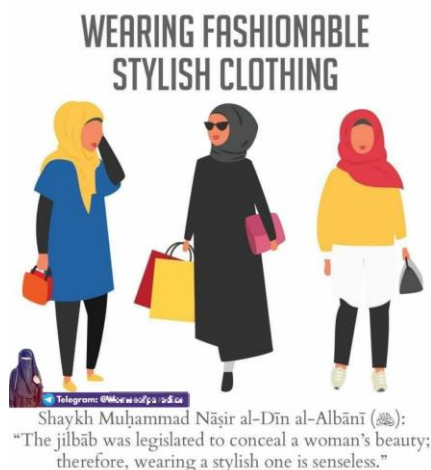
Joonis 6. Islamiäärmuslaste Telegrami kanalis jagatud teave seoses mosleminaiste riietumisnõuetega

džihadismi organisatsioonide seoses naistepõhiste narratiividega, nähtub, et suur osa sisust käsitleb nüüdisaegseid ja igapäevaprobleeme (41). Paljudel juhtudel põhinevad motivatsiooninarratiivid traditsioonilistel doktriinidel ja kontseptsioonidel, kuid käsitlevad Lääne riikides elavate mosleminaiste identiteediprobleeme. Selle uuringu kohaselt kasutatakse tihti muu hulgas narratiive, mis on seotud „islami õdedeks olemise au“ ja nende ühise kohustusega seista oma deeni eest (see viitab araabiakeelsele sõnale dīn , mis tähendab religiooni) (42).