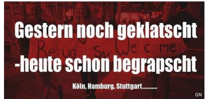
Joonis 1. Facebookist hangitud kujutis

kasutajate osakaal varieerub vaid vahemikus 70–73 %) (11) . Seega on Facebook endiselt tüdrukutele ja noortele naistele suunatud äärmuslaste tegevuse analüüsimise, ennetamise ja tõkestamise seisukohast asjakohane platvorm. 2021. aasta oktoobri alguses avaldas endine Facebooki töötaja Frances Haugen ettevõtte sisedokumendid, millest selgus, et platvormi algoritm suunab aktiivselt teismelisi kasutajaid kahjuliku sisu juurde (12) . Lekkinud failide ja Hugen USA senati ees antud tunnistuste kohaselt löikab Facebook kasu algoritmist, mis võimaldab noorte naissoost kasutajate ebakindlust ära kasutada ja seda võimendada. Kuigi äärmuslaste kavatsused erinevad kasumile orienteeritud ettevõtete omadest, võib öelda, et nende lähenemismuster on sarnane selles mõttes, et ka nemad keskenduvad sotsiaalmeedias sihtrühmade ebakindluse ja haavatavuse ärakasutamisele. Facebook palkas 2019. ja 2020. aastal uurijad, kelle ülesanne oli uurida soovitusüsteemide rolli kasutajate polariseerimisel. Uurijad leidsid testkontode loomise abil, et mõni kasutaja lükati nn jäneseurgudesse ja viidi kokku vandenõuteooriatega (13) . Äärmuslased on platvormil organiseeritud vahel avalikese gruppidesse ja lehekülgedele või suletud gruppidesse (kus liitumise üle otsustavad grupi administraatorid)